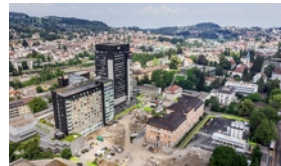
Kantonsspital St. Gallen, Areal