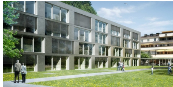
Clinique des Grangettes - Bâtiment nord

Clinique des Grangettes – M. D. Cheminat Chemin des Grangettes 7 1224 Chêne-Bougeries