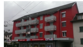
Haus von Aussen