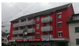
Bloc de bâtiments