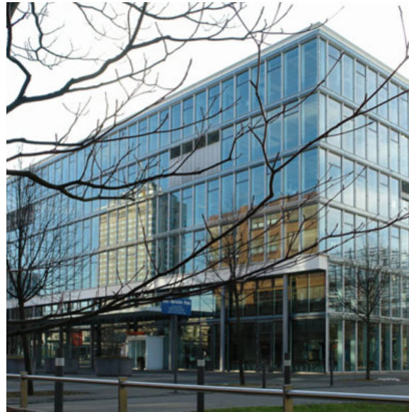
Ansicht Haupteingang ABB des Cityports