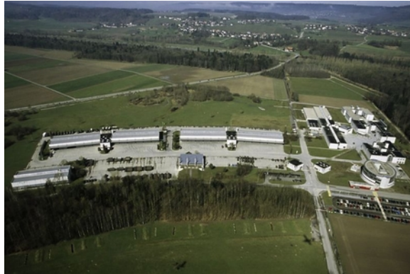
Vue aérienne de la place d'armes