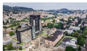
Kantonsspital St. Gallen, Areal