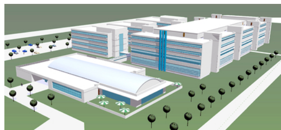
Vista lato sud